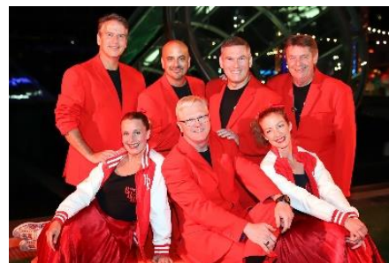
Baby Boomer's Band