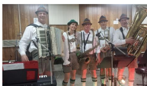
Bavarois Ein Prosit