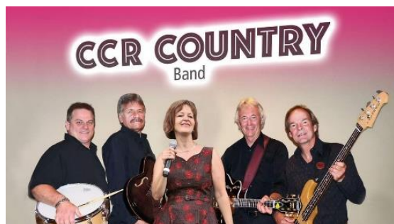
CCR Country Ban